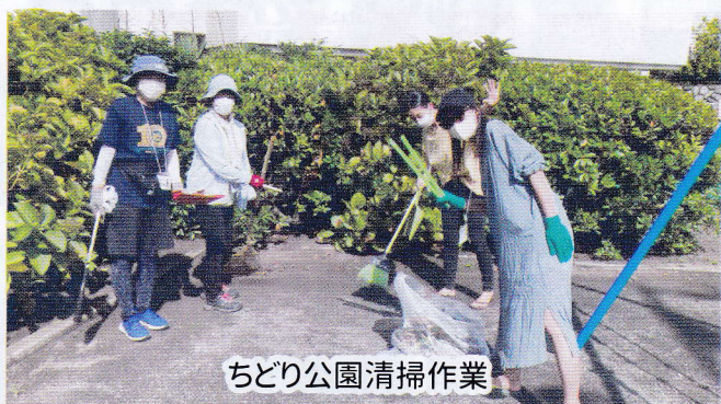
ちどり公園清掃作業